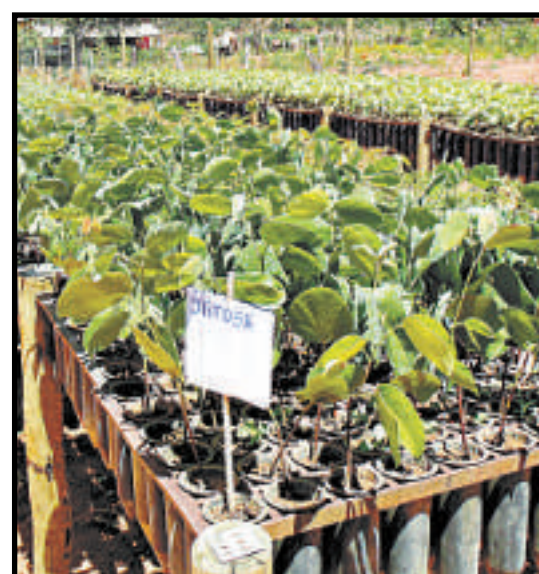
Viveiro de mudas para recuperação de matas ciliares e nascentes do córrego João Moreira

EXPECTATIVAS Devido ao secamento do córrego, os moradores de João Moreira recorrem a poços tubulares. A partir das intervenções do projeto Meu Rio, eles estão na expectativa de que a água superficial retorne e que não fiquem mais na dependência do lençol freático, cujos reservatórios são cada vez mais reduzidos na região, devido à sua grande exploração. “Todos aqui